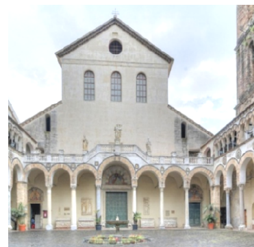
Собор Святого Матфея в Италии, где находятся мощи апостола. XI в.

Когда Матфей проповедовал в Африке, правитель-язычник велел его распять на земле и сжечь на огне, обложив хворостом. Однако огонь перекинулся на статуи языческих идолов, которые сгорели. Апостол тоже погиб, но сам мучитель, увидев происходящее, обратился в христианство и крестился с именем Матфей.