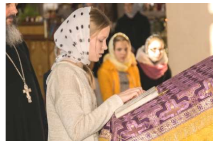
Дети читают по молитвослову