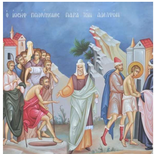
Братья продают Иосифа в рабство. Фреска