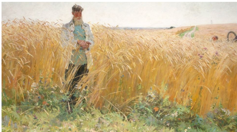
Александр Бубнов. Хлеб. 1948 г.

На второй день перед вечером к Чернокосой матери снова приехал сын –