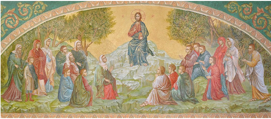
Нагорная проповедь. Фреска храма Воскресения Христова и Новомучеников и Исповедников Церкви Русской. Сретенский монастырь г. Москвы, 2017 г.