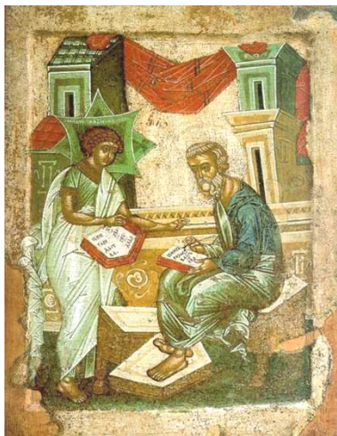
Апостол Матфей пишет Евангелие. Русская икона XV в.