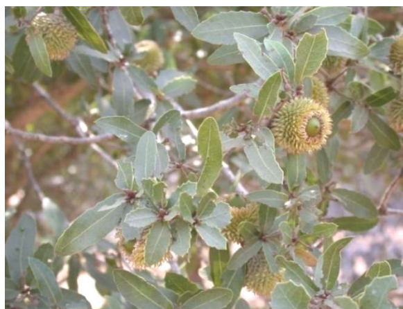
Листья палестинского дуба