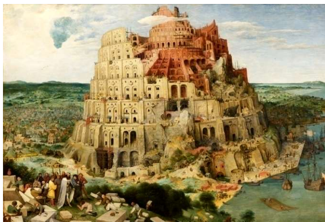
Питер Брейгель старший. Вавилонская башня, 1563 г.

Кому хочется иметь допотопный телефон или компьютер? Рассмеётесь в ответ на такой вопрос и скажете: «До всемирного потопа не было ни гаджетов, ни Интернета». Конечно, ведь вы уже знаете, как произошло это библейское событие. А кто-то под словом «допотопный» подразумевает то, что давно устарело. С помощью допотопного телефона или компьютера не получится связаться с другом из Аргентины по видеосвязи. А если не знаешь испанского языка, то и современная техника не поможет.