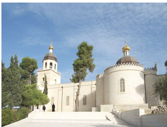
Монастырь Святой Троицы в Хевроне

К сожалению, сейчас Мамврийский дуб находится в плачевном, засохшем состоянии. Последний лист на нём упал в 1996 году. Ствол поддерживают металлические опоры.