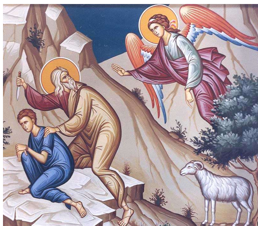
Жертвоприношение Авраама – прообраз жертвы Христовой. Фреска

Он тоже будет учить, что любовь к Богу должна быть выше всего, даже любви к родным: «Возлюбí Господа Бога твоего всем сердцем твоим и всёю душею твоею и всем разумением твоим: сия есть первая и наибольшая заповедь; вторая же подобна ей: возлюби ближнего твоего, как самого себя; на сих двух заповедях утверждается весь закон» (Мф. 22, 35-40). Задумайтесь: человек, любящий Бога, будет ли плохо делать родным? Конечно, нет. Потому что любовь к Богу выражается прежде всего в любви к ближним, в добром отношении к ним.