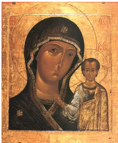
Казанская икона Божией Матери. 1649 г.