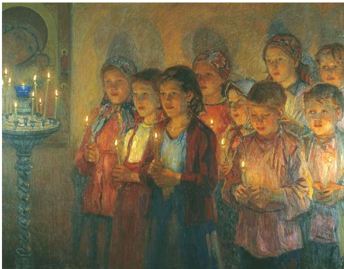
Н.П. Богданов-Бельский. В Церкви. 1939 г.

Я пошёл в коридор и из него в гостиную. Она была тёмной, но в кабинете у папы горел свет, и дверь туда была приоткрыта. Всё ещё подавленный страхом, с каким я отошёл от Серёжи, я подошёл к двери. Я увидел папу и маму.