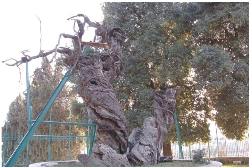
Мамврийский дуб. Современная фотография

Кажется совершенно невероятным, но дуб, под которым Авраам принимал пришедших к нему Гостей, сохранился до наших дней. Авраам предложил трём ангелам, явившимся ему в образе скромных путников: «Отдохните под сим деревом» (Бытие 18, 4).