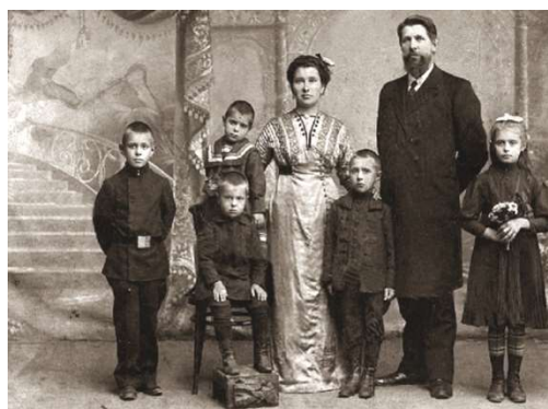
Российская семья. Фото 1912 г.

Как стало скучно в доме. Точно все прятались, не говорили громко. Был один особенно тяжёлый и страшный день. Наступил вечер. Было уже темно, и в комнатах зажгли