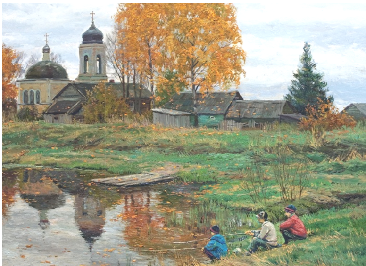
Станислав Брусилов. Осень