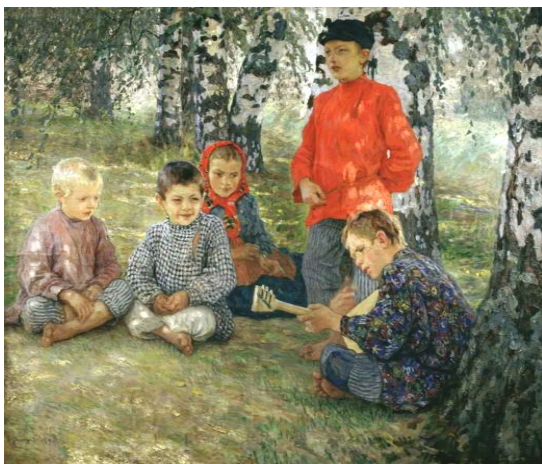
Н.П. Богданов-Бельский. Virtuoz. 1891 г.