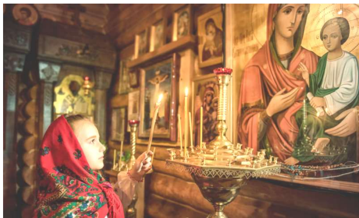
Девочка в Церкви у иконы Пресвятой Богородицы. Современное фото