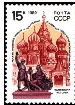
Почтовая марка СССР, 1989 г.

Правильный путь, правой рукой, православная икона... Правое дело было за русским народом, когда он опирался на ценности православия. Особенно во время нападений врага. И тут Казанская икона Божией Матери играла немаловажную роль в поднятии боевого духа людей, мужественном настрое и надежде на Божию помощь и заступничество Богородицы. Например, во время польско-литовского нашествия и смуты Кузьма Минин и Дмитрий Пожарский организовали ополчение и прогнали западных интервентов, желающих захватить Русь и насадить свои порядки и католическую веру. До Москвы двигалось это ополчение с Казанской иконой Божией Матери, которая теперь так и хранится в столице – в Елоховском соборе. В память об этих событиях 4 ноября по всей России отмечается День народного единства.