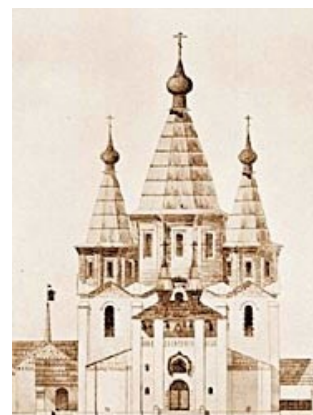
Проект храма Елисаветинской общины в Шаховской (нач. XX в.)

В 1892 году Великой Княгиней Елизаветой Федоровной Романовой, немкой по происхождению, супругой Великого Князя Сергея Александровича, генерал-губернатора Москвы, был разработан устав Елисаветинского общества. При многих церковных приходах Москвы и губернии Обществом были организованы Елисаветинские общины сестер милосердия, осуществляющие широкомасштабную благотворительную и просветительскую деятельность.