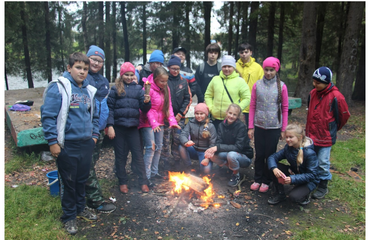
Турпоход Anesti в праздник Воздвижения Креста Господня

Вы держите в руках первый выпуск духовно-просветительского листка православного движения Anesti, в котором сможете узнать о нашей деятельности, найти для себя что-то полезное и новое. Наше общественное движение основано в целях комплексного духовно-нравственного воспитания и просвещения молодежи на основе православных ценностей. Основная задача движения – объединить всех, кто желает сам быть истинным христианином и помогать другим. Для этого мы проводим и планируем проводить различные мероприятия: обучение основам православной культуры, паломнические поездки, конференции, акции милосердия, курсы для родителей, встречи со священниками, квесты, праздники, вечера и другое. Сейчас уже работает православный кружок для школьников на базе Шаховской школы №1, налажено сотрудничество с Православным Свято-Тихоновским гуманитарным университетом. Вступить в движение может любой желающий старше 10 лет, независимо от места жительства и учебы. Мы рады волонтерам, интересным идеям и любой помощи для развития движения Anesti.