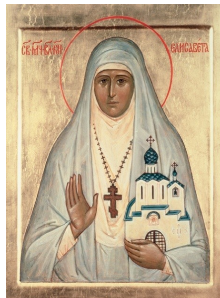
Преподобномученица Великая Княгиня Елисавета

Нерусская по происхождению, Елисавета Федоровна стала подлинно русской по духу благодаря православию. Она прославлена в лике святых в 1992 году. Её жертвенное служение бедным, больным и сиротам, ее искренняя любовь к Богу, к России, к Православной Церкви и сегодня пробуждают наши души, напоминая нам о нашей ответственности перед Богом за себя, за своих близких и за свою страну.