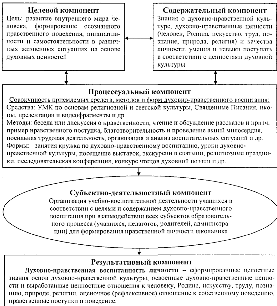
Рисунок 1 – Система духовно-нравственного воспитания младших школьников и подростков

Далее в работе рассматривается учет связи обучения основам духовно-нравственной культуры с другими учебными предметами как базовое условие, определяющее эффективную реализацию комплексного подхода к духовно-нравственному воспитанию младших школьников и подростков. Оно представлено в содержательной модели сопряженности учебных элементов, формируемых на уроках духовно-нравственной культуры, в кружке по духовно-